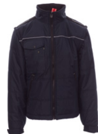
ORION 2.0 ITEM CODE 001030-0049 COLOR CODE 08007