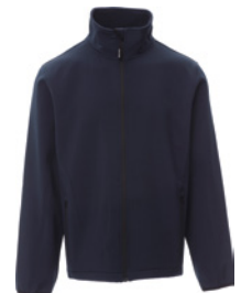
PERTH ITEM CODE 001474-0491 COLOR CODE 08007