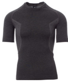
THERMO PRO 160 SS ITEM CODE 001531-0494 COLOR CODE 14001