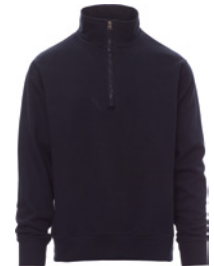
CANADA ITEM CODE 000867-0308 COLOR CODE 08007