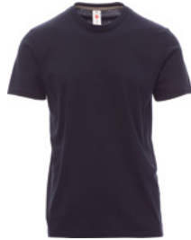
SUNSET ITEM CODE 000101-0030 COLOR CODE 08007