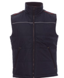
RADAR 2.0 ITEM CODE 001031-0049 COLOR CODE 08007