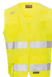
EXPERT ITEM CODE 000335-0088 COLOR CODE 01006