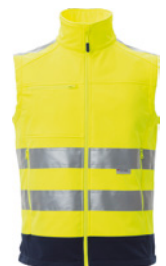
TRAFFIC ITEM CODE 001449-0090 COLOR CODE 01014