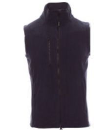
EASY+ ITEM CODE 000843-0069 COLOR CODE 08007