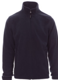
NEPAL ITEM CODE 001088-0325 COLOR CODE 08007