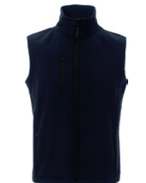
GLASGOW ITEM CODE 001363-0355 COLOR CODE 08007