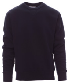
ORLANDO ITEM CODE 001083-0308 COLOR CODE 08007