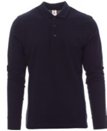
VERONA ITEM CODE 001213-0373 COLOR CODE 08007