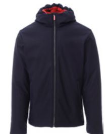
OREGON ITEM CODE 001517-0489 COLOR CODE 08023