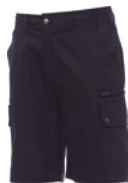
RIMINI SUMMER ITEM CODE 001193-0067 COLOR CODE 08007