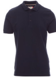
VENICE ITEM CODE 000907-0305 COLOR CODE 08007