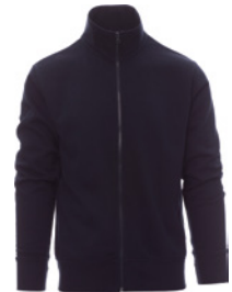
HOUSTON ITEM CODE 001085-0308 COLOR CODE 08007