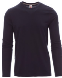
PINETA ITEM CODE 000893-0033 COLOR CODE 08007