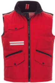
MIG 2.0 ITEM CODE 001011-0051 COLOR CODE 02012