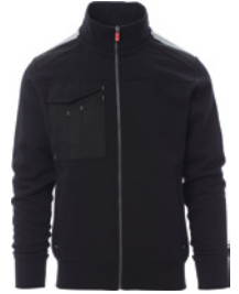
WORK 2.0 ITEM CODE 001382-0001 COLOR CODE 14000