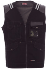
TUCSON ITEM CODE 000317-0064 COLOR CODE 14025