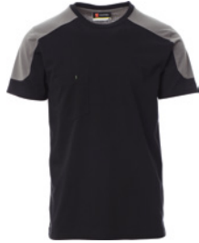
CORPORATE ITEM CODE 001464-0438 COLOR CODE 14025