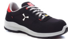
GET TEXFORCE LOW ITEM CODE 001481-0464 SUT COLOR CODE S0005