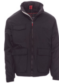
RENEGADE ITEM CODE 000871-0051 COLOR CODE 14023