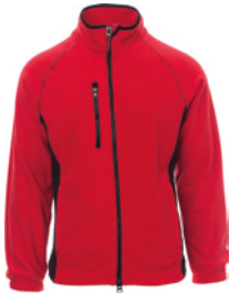
ASPEN+ ITEM CODE 001004-0069 COLOR CODE 03015