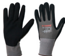
01-101 ITEM CODE 001476-0457 COLOR CODE 13014