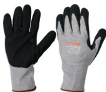
01-301 ITEM CODE 001477-0458 COLOR CODE 13014