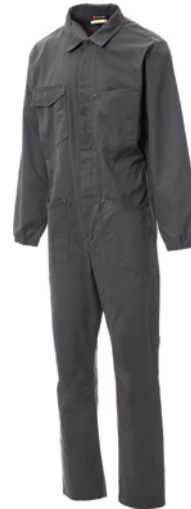
COVER ITEM CODE 001262-0331 COLOR CODE 13007