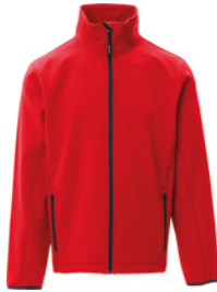
PERTH ITEM CODE 001474-0491 COLOR CODE 03000