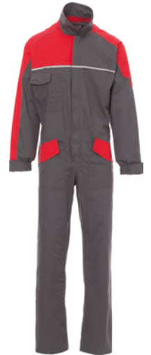
PROMOTECH ITEM CODE 000961-0340 COLOR CODE 13041