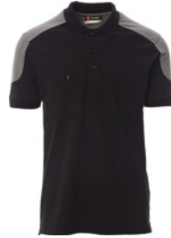
COMPANY ITEM CODE 001465-0440 COLOR CODE 14025