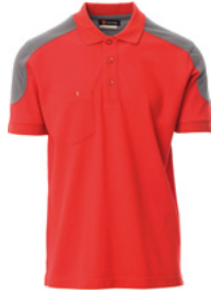
COMPANY ITEM CODE 001465-0440 COLOR CODE 03021