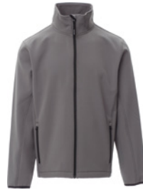
PERTH ITEM CODE 001474-0491 COLOR CODE 13008