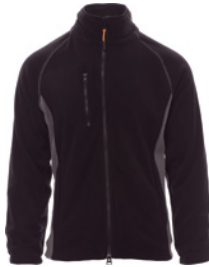
ASPEN+ ITEM CODE 001004-0069 COLOR CODE 14023