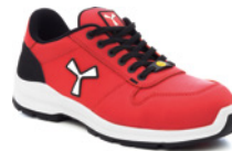
GET FORCE LOW ITEM CODE 001467-0414 NBK COLOR CODE S3000