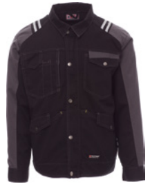
ARIZONA ITEM CODE 000319-0064 COLOR CODE 14025