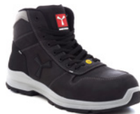
GET FORCE MID ITEM CODE 001445-0414 NBK COLOR CODE S0000