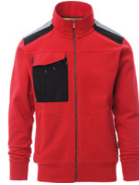
WORK 2.0 ITEM CODE 001382-0001 COLOR CODE 03000