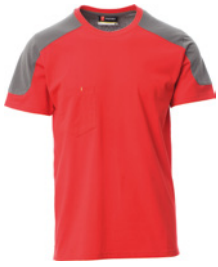
CORPORATE ITEM CODE 001464-0438 COLOR CODE 03021